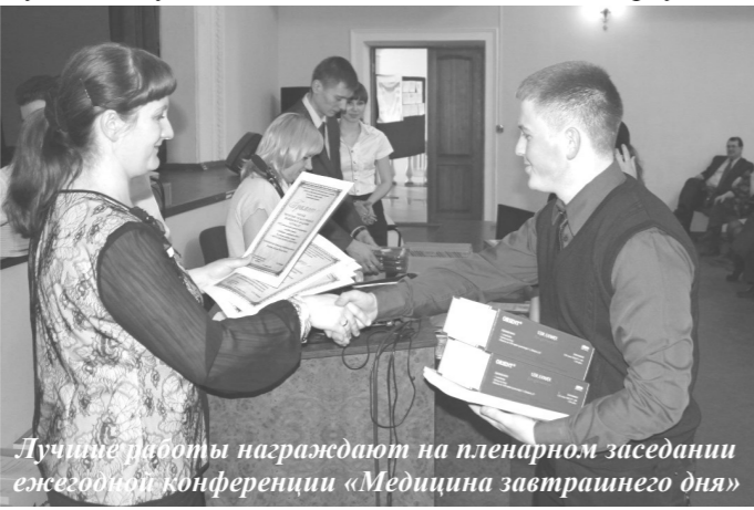
Лучшие работы награждают на пленарном заседании ежегодной конференции «Медицина завтрашнего дня»

Более подробно с правами и обязанностями члена МНО можно ознакомиться в «Положении о молодежном научном обществе ЧГМА». Полный текст его размещен на официальном сайте академии на странице общества; а отдельные выдержки - на стенде МНО в главном корпусе.